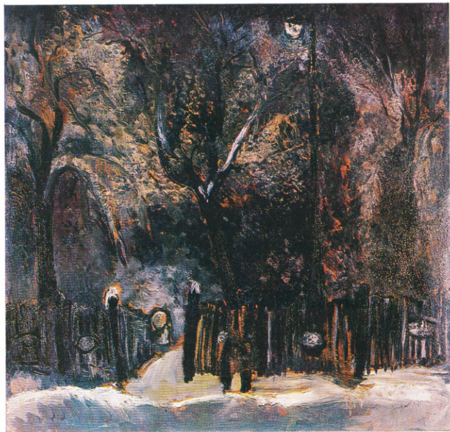
Сад зимой 1966