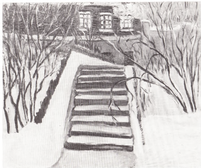
Пейзаж с лестницей. Вечер 1964—1965