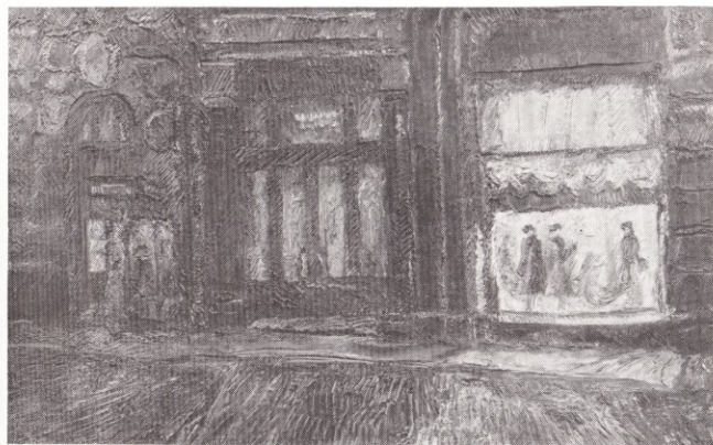
Кузнецкий мост. Дом моделей 1978