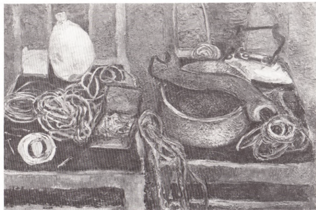
Натюрморт с проволокой 1964—1965