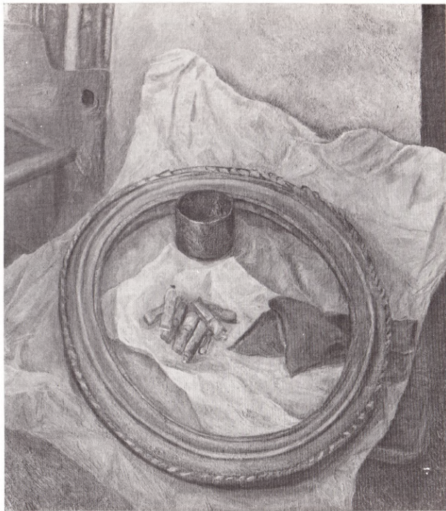
Рама и краски Ильи Машкова 1973