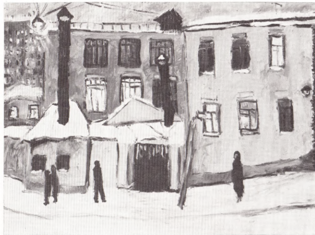
Рождественский бульвар 1979