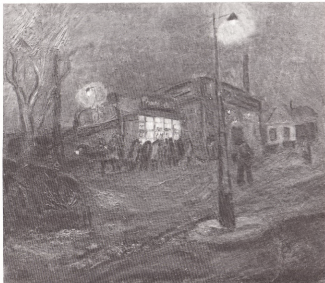
Пиво пьют 1967