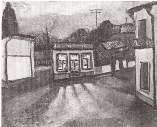
Алушта. «Маргаритка» 1966

НАТЮРМОРТ С ПЕРЧАТКАМИ К., м. 45×74 НАТЮРМОРТ С КОФЕЙНОЙ МЕЛЬНИЦЕЙ Х., м. 53×63