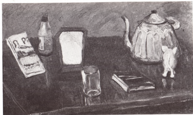
Натюрморт со слоном 1964