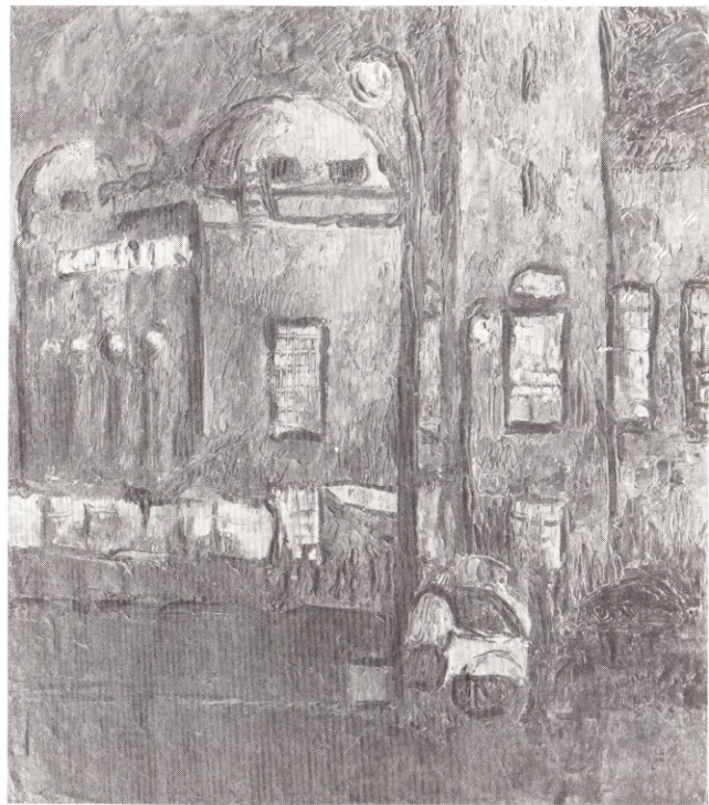
Киевский вокзал 1965

Все это, вместе взятое, определяя общую направленность творчества Ирины Болотиной, не помешало ей обрести и собственное индивидуальное лицо, особые качества и свойства в живописно-образном решении тем, которые ей были наиболее близки и