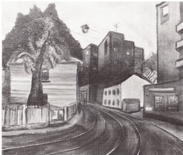
Конюшковская улица 1966

УЛИЦА КИРОВА. УТРО Х., м. 60×120 УЛИЦА КИРОВА. ВЕЧЕР Х., м. 60×120 ПЕЙЗАЖ С ДОМИКОМ. СОЛНЦЕ СКВОЗЬ ТУМАН К., м. 66×82 Собственность И. Я. Лучковского. Харьков ЖАСМИН К., м. 66×68 ПЕЙЗАЖ С ЧЕРНОЙ СОБАЧКОЙ К., м. 66×76