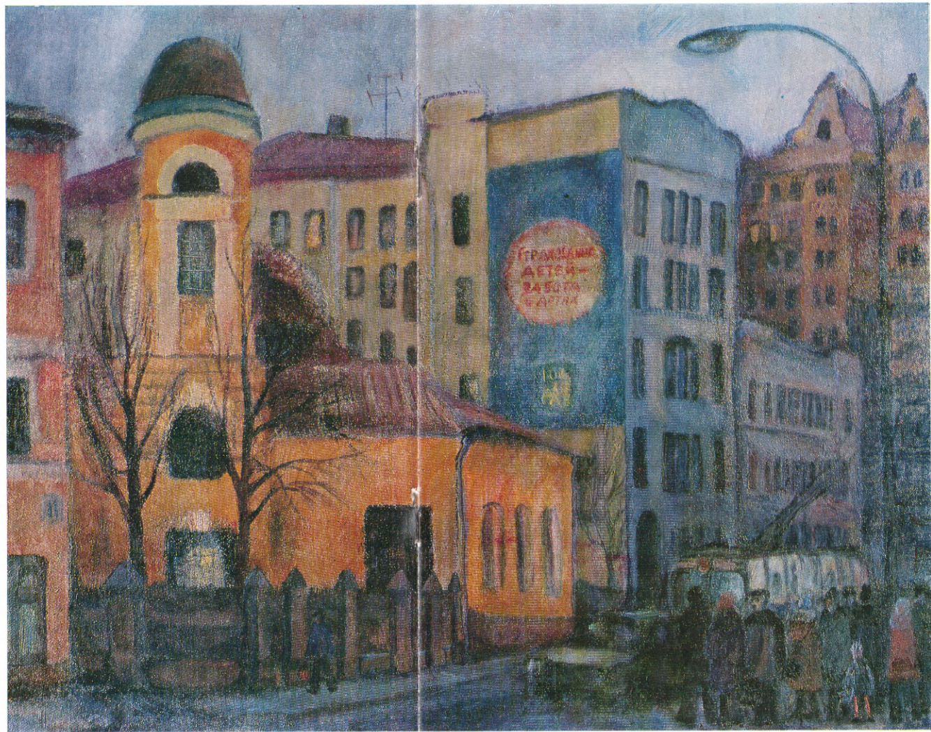
Москва, Пушечная улица 1979