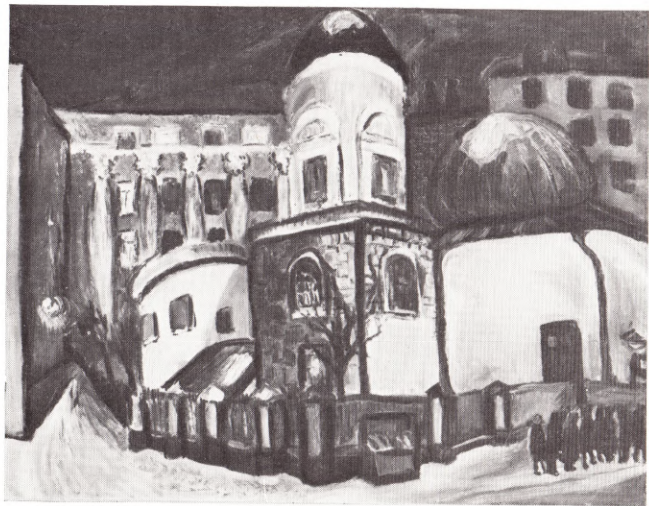
Пушечная улица 1966—1967