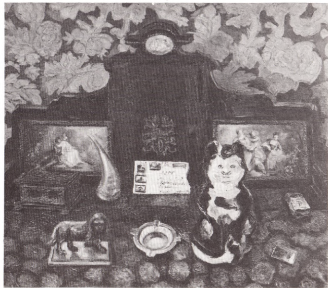
Натюрморт с кошечкой 1969